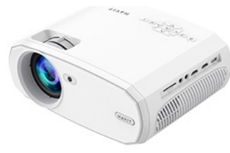
HAVIT PROYECTOR PJ202 PRO-EU