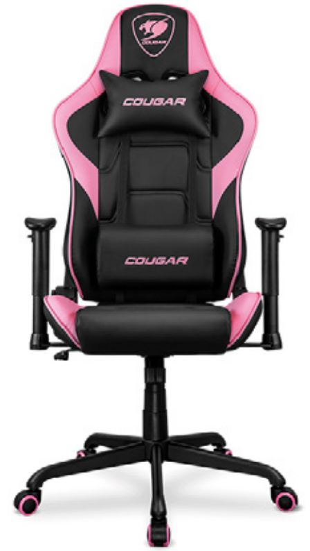
ARMOR ELITE EVA 3MELIPNB.0001 cod- 1320203198 $129.990