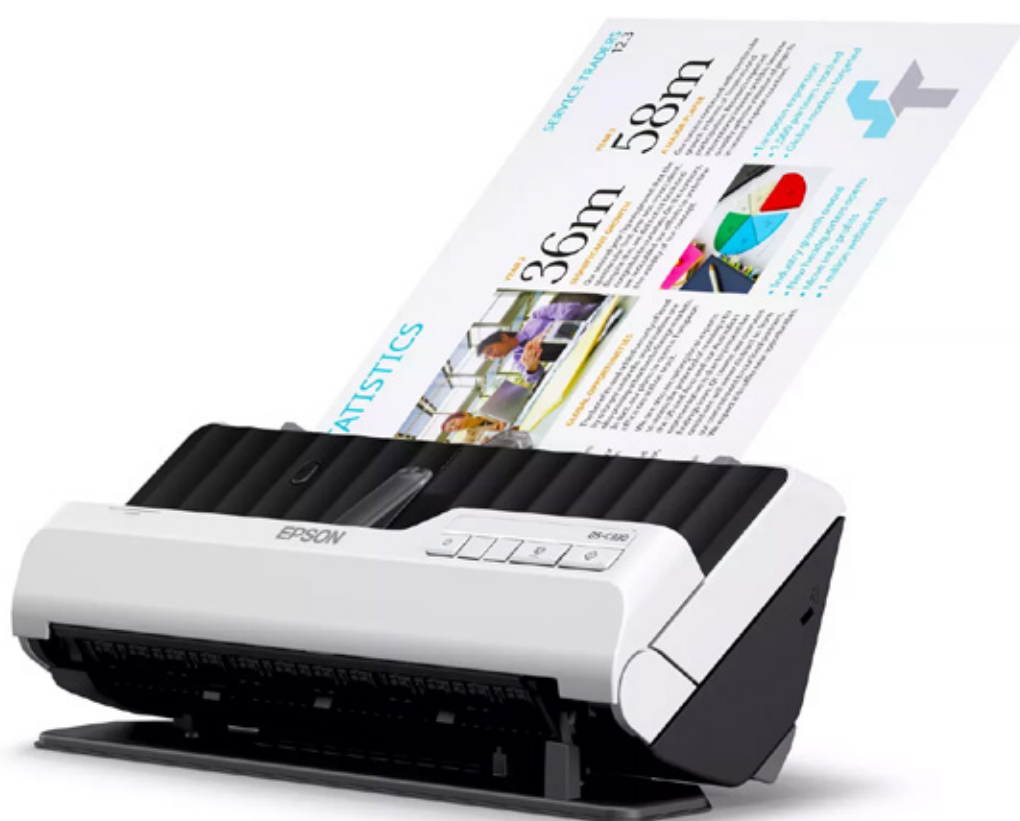
EPSON SCANNER DS-C330 (B11B272201)