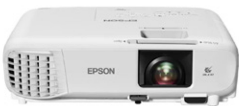
EPSON PROYECTOR POWERLITE X49