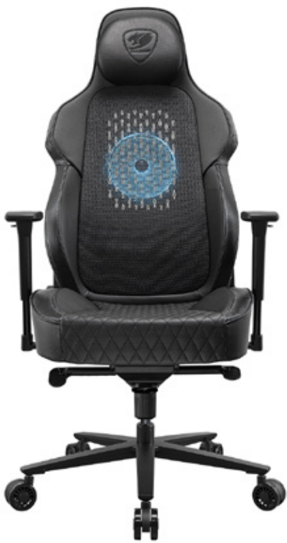
NXSYS AERO BLACK 3MARPBLB.0001 cod- 1010101107 $279.990