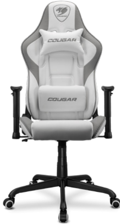
ARMOR ELITE WHITE 3MELIWHB.0001 cod- 13202031459 $129.990