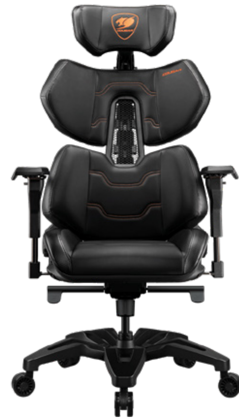
TERMINATOR 3MTERNXB.0001 cod- 12702005 $479.990