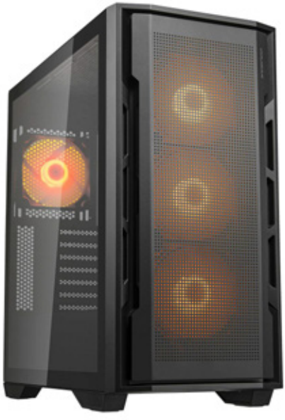
COUGAR UNIFACE RGB BLACK 385C780.0001 $60.990 CLP cod - 132020304143