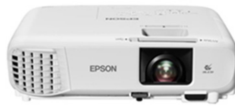
EPSON PROYECTOR POWERLITE E20