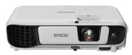
EPSON PROYECTOR EPSON POWERLITE W52+