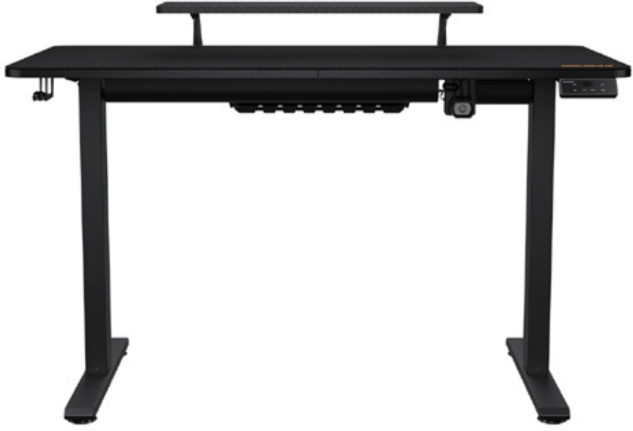
MESA GAMER ELÉCTRICA E-STAR 120 cod- 101020204001 $124.990