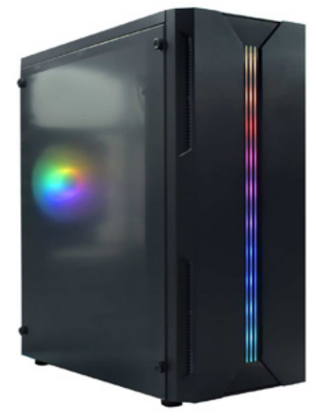
LINKWORLD GABINETE CASE CA-LCC VC08A01 $29.990 CLP cod - 132020304148