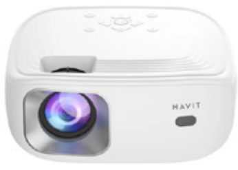
HAVIT PJ212 - EU