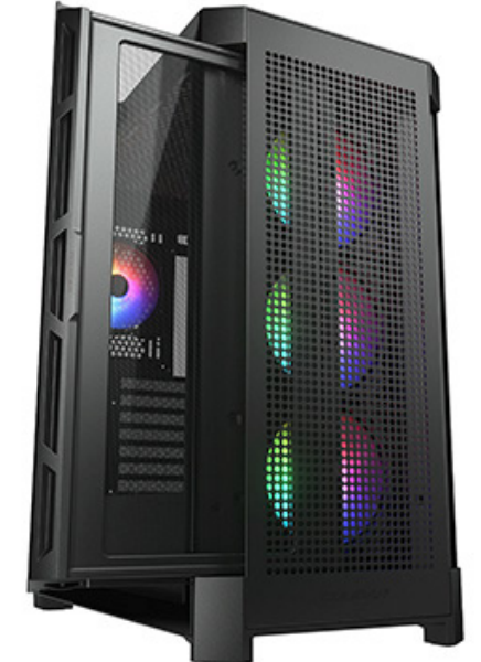
COUGAR DUOFACE PRO RGB 385AD10.0001 $75.990 CLP cod - 132020304123