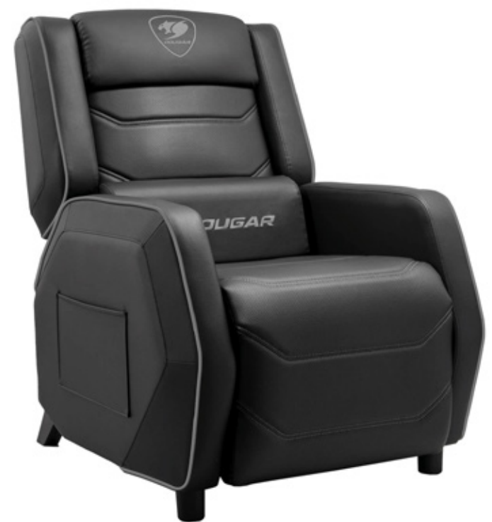
RANGER S BLACK 3MRGSBLB.0001 cod- 1200102002 $169.990