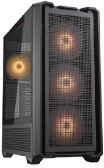
COUGAR MX600 RGB BLACK 3857C90.0001 $95.990 CLP cod - 132020304135