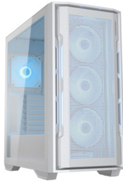
COUGAR UNIFACE RGB WHITE 385C780.0002 $65.990 CLP cod - 132020304144