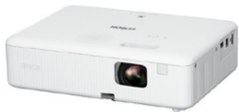
EPSON PROYECTOR FLEX CO-W01