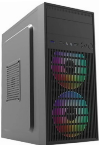
LINKWORLD GABINETE CASE CA-LCC VC18-M01 $20.990 CLP cod - 132020304149