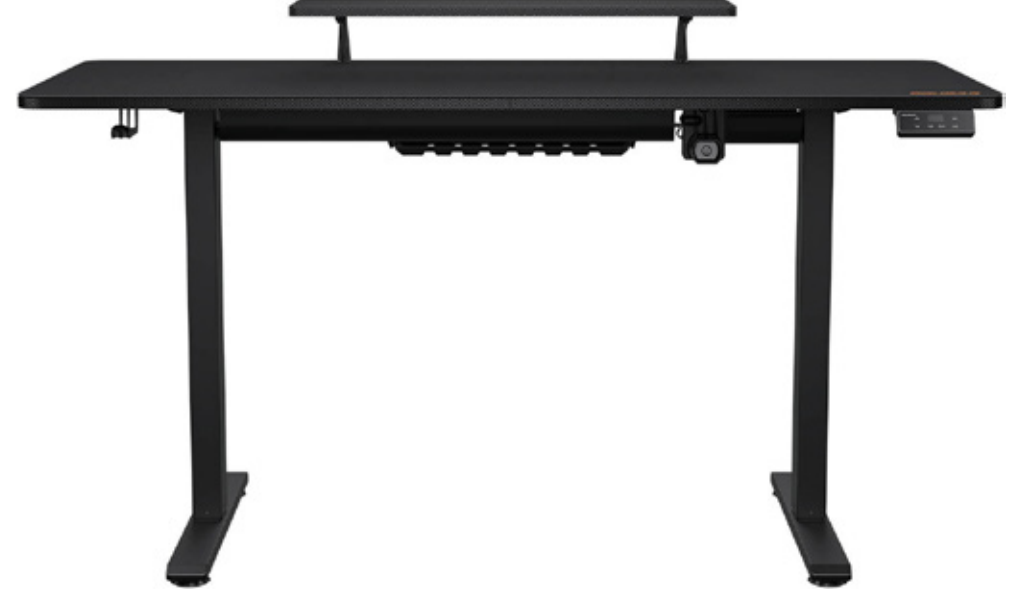
MESA GAMER ELÉCTRICA E-STAR 140 cod- 1010303001 $139.990