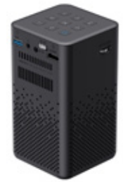
HAVIT PROYECTOR PJ208-EU