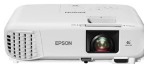
EPSON PROYECTOR POWERLITE W49