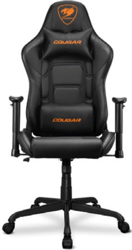
ARMOR ELITE BLACK 3MELIORB.0001 cod- 1200102001 $129.990