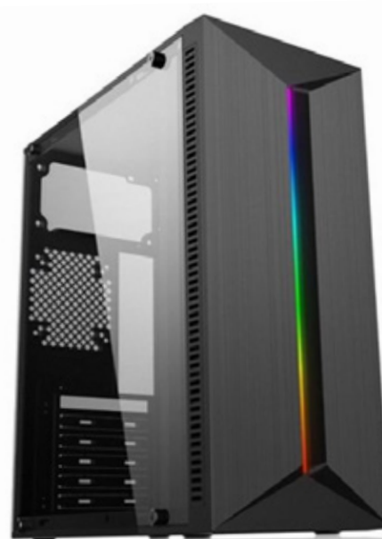
LINKWORLD GABINETE CASE CA-LCC VC18A02 $24.990 CLP cod - 132020304150