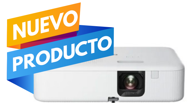
EPSON PROYECTOR EPSON EPIQVISION FH02