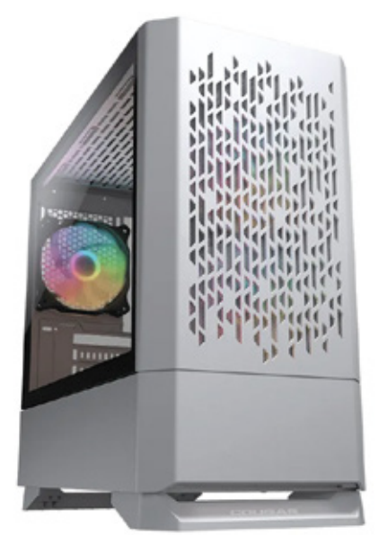
COUGAR AIRFACE ECO RGB 385YA20.0001 $84.990 CLP cod - 1013401040