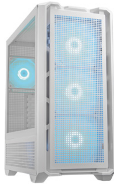
COUGAR MX600 RGB WHITE 3857C90.0002 $99.990 CLP cod - 132020304138