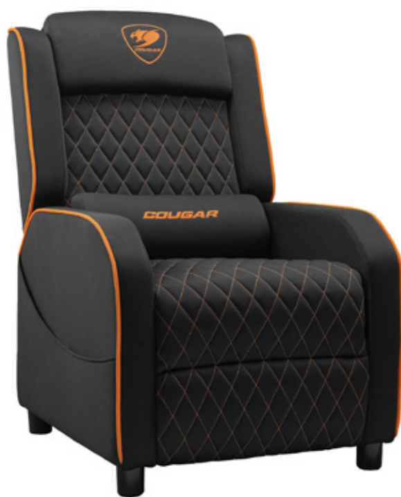
RANGER ONE 3MRGPGLB.0001 cod- 101020203001 $149.990