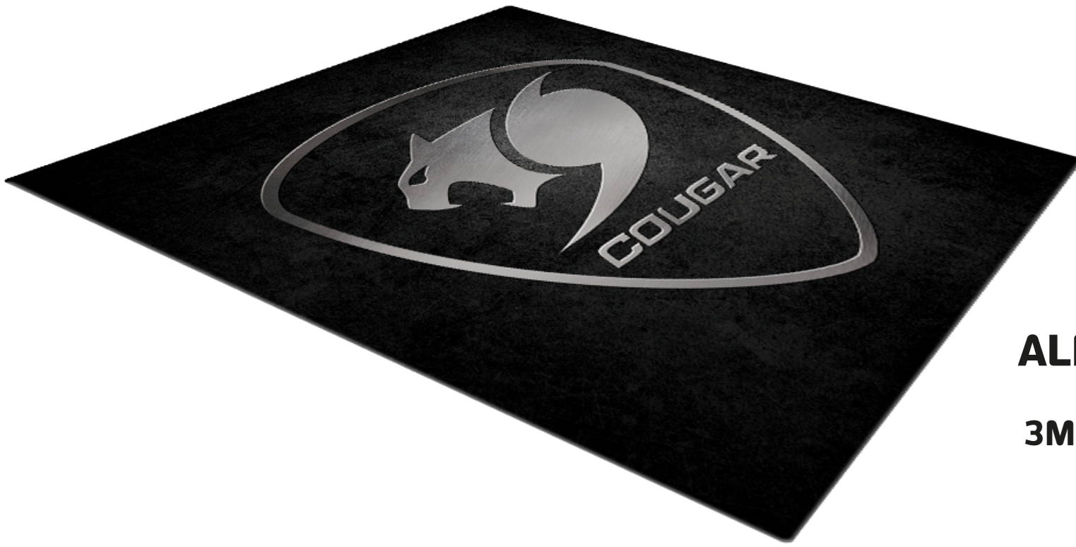
ALFOMBRA COMMAND BLACK 1100 x 4 x 1100 mm 3MCOMFMB.0001 • cod- 13202031210 $32.990